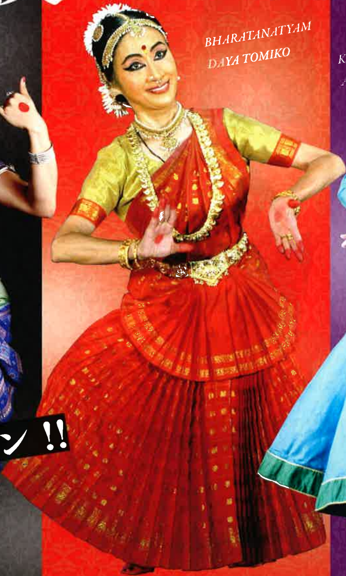
BHARATANATYAM DAYA TOMIKO